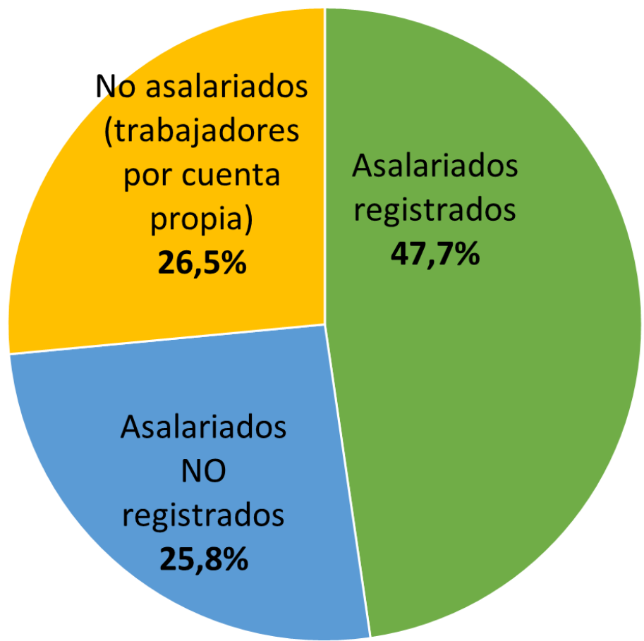
Composición de los ocupados según categoría ocupacional, 2019 (en %)