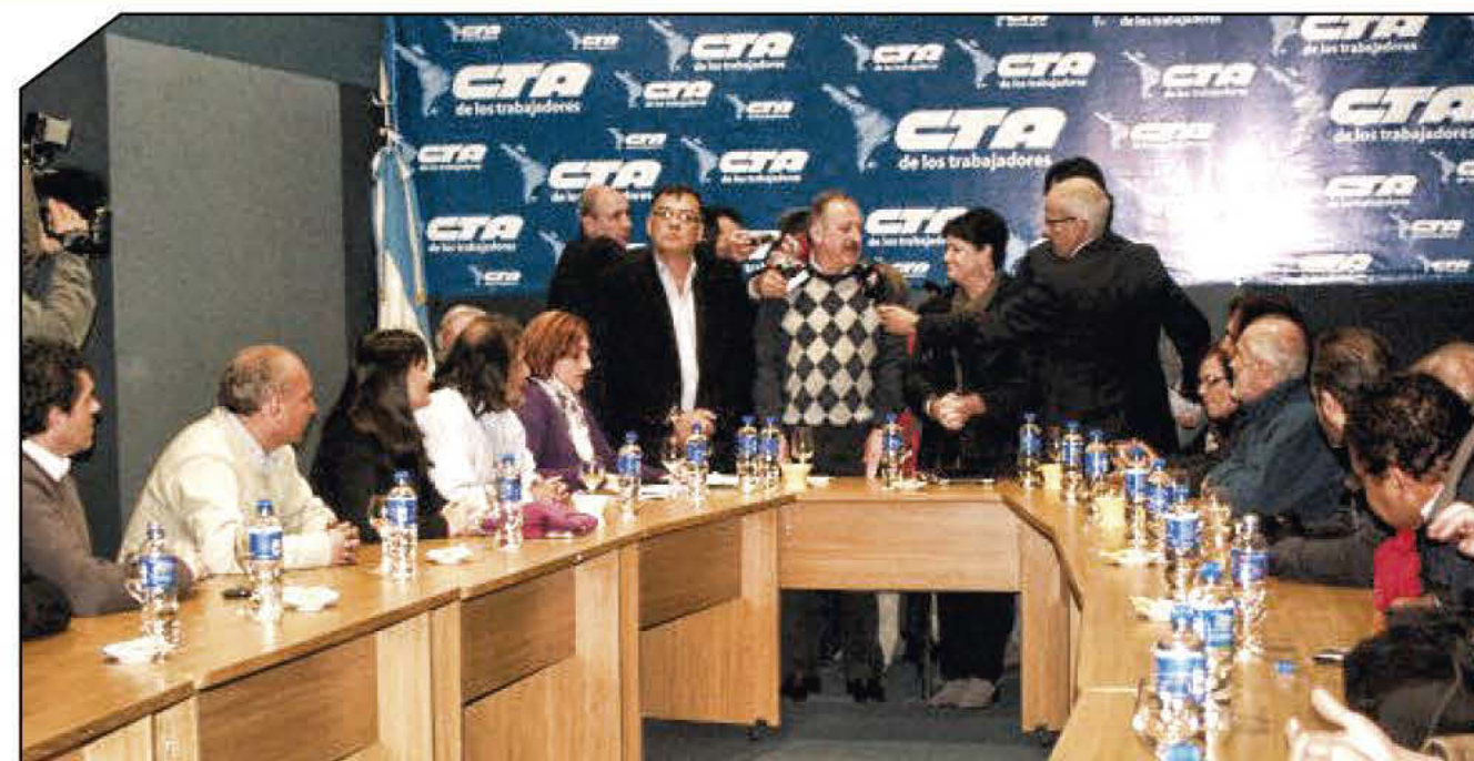
En el mes de agosto, la mesa nacional de la Central de Trabajadores de la Argentina recibió Sharan Burrow, presidenta de la Central Sindical Internacional.

Además, Da Silva Santos añadió luego algunos números que grafican los logros obtenidos durante los dos períodos de Lula: 26.000 brasileños salieron de la línea de pobreza, se crearon 15 millones de nuevos puestos de trabajo en los ocho años de mandato, se desarrollaron plataformas políticas que valorizaran y dignificaran el trabajo, yendo contra la informalidad y la precarización laboral, desarrollando un modelo sustentable e incrementando tanto el crecimiento tanto como el PBI. Todo esto, en un país latinoamericano con 192 millones de habitantes.